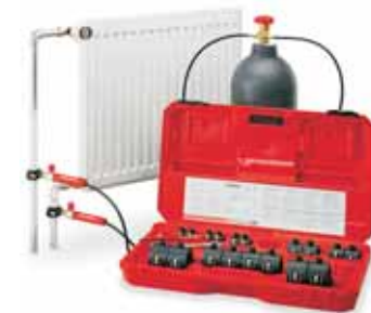
Rothenberger Rofrost CO2